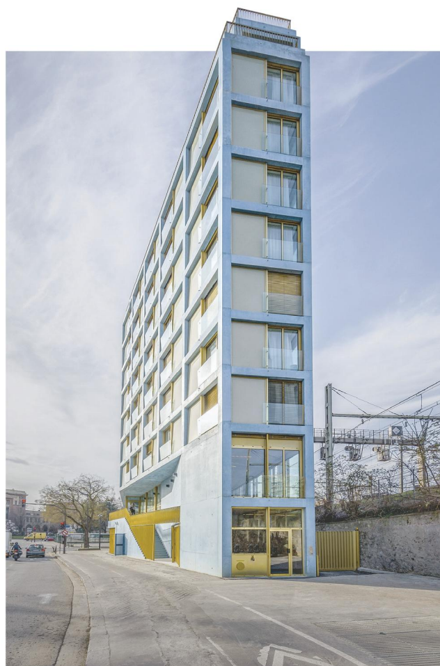
Habitat Résidence Julia-Bartet, centre de formation pour apprentis et centre de distribution des Restos du cœur à Paris (XIV e )

Comme lors de la précédente édition, les concepteurs auront à défendre eux-mêmes leur réalisation. Ils auront la tâche de convaincre, en quelques minutes, les membres d'un jury qui sera, cette année, placé sous la présidence de l'architecte Paul Chemetov. A l'issue de ses délibérations, le jury dévoilera son palmarès au cours d'une soirée de cérémonie organisée le 25 novembre prochain, à l'Institut du monde arabe (IMA), à Paris (V e ). Les trophées seront alors remis à ceux qui auront permis aux réalisations lauréates de voir le jour, leur architecte mais aussi leur indispensable maître d'ouvrage. ● La rédaction